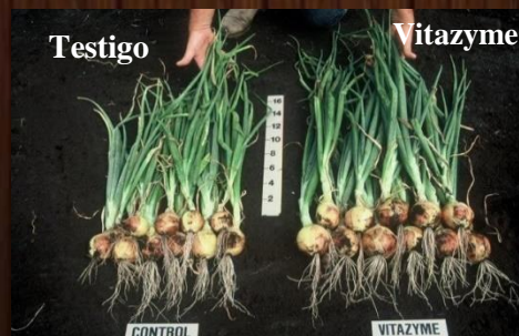
Cebolla, izq. testigo, der. Vitazyme.