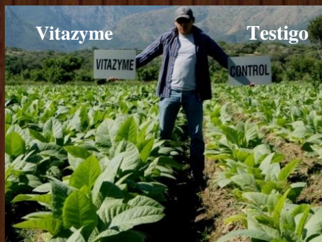
Tabaco, izq. Vitazyme, der. testigo.