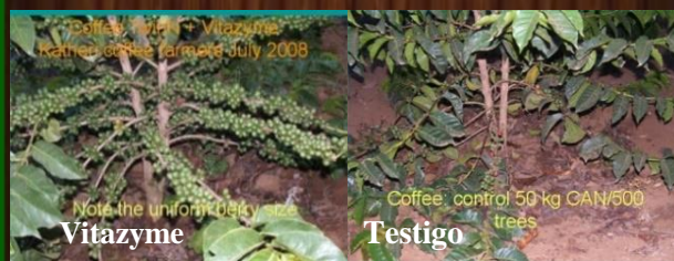
Café, izq. Vitazyme, der. testigo.