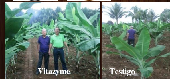
Banano/plátano, izq. Vitazyme, der. testigo.