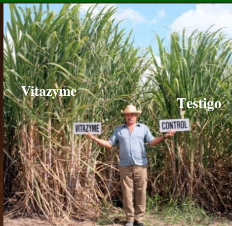
Caña de azúcar, izq. Vitazyme, der. testigo.

Es compatible con todos los productos agroquímicos: herbicidas, insecticidas, fungicidas y fertilizantes foliares.